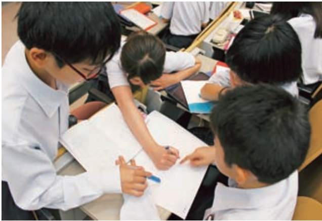
グループワークでお互いの考えをすりあわせる生徒たちの様子。

導入では、風や雪で大きく曲がっても、折れずに回復し、節目節目で大きく成長する「竹」を例に、レジ