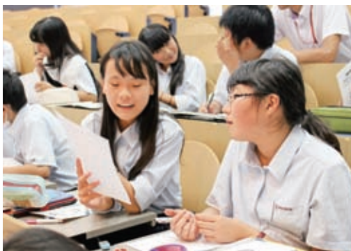
ペアの相手と交替で自分の立ち直り体験を話す生徒たち。