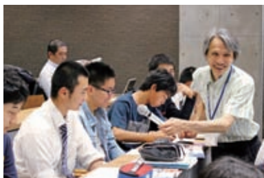
生徒の意見をグラフィック・レコーディングで受け止め、インタラクティブな授業を行いました。